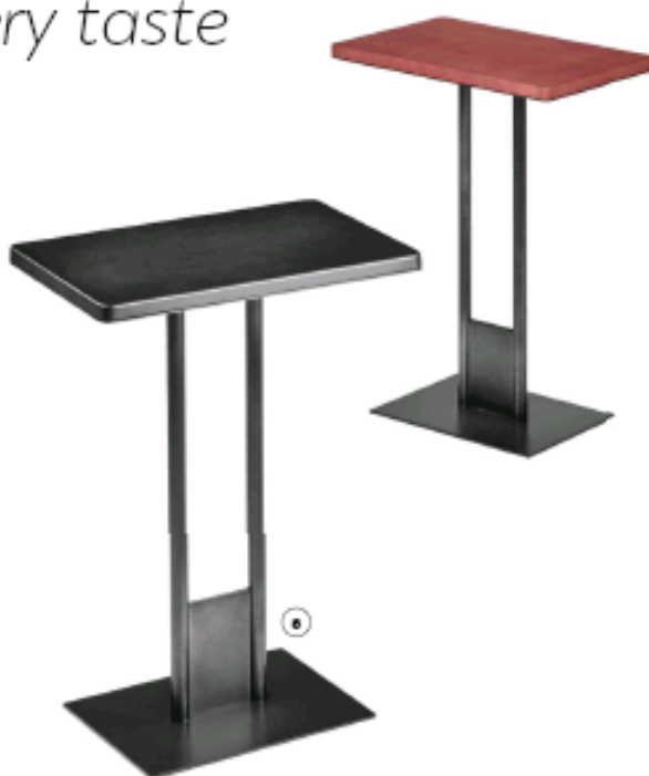
5. Guéridon en acier doré poli. Polished gilt steel pedestal table. 137 - h 42 - p 30 cm, design Rodolfo Dordoni, Fiv, Minotti.